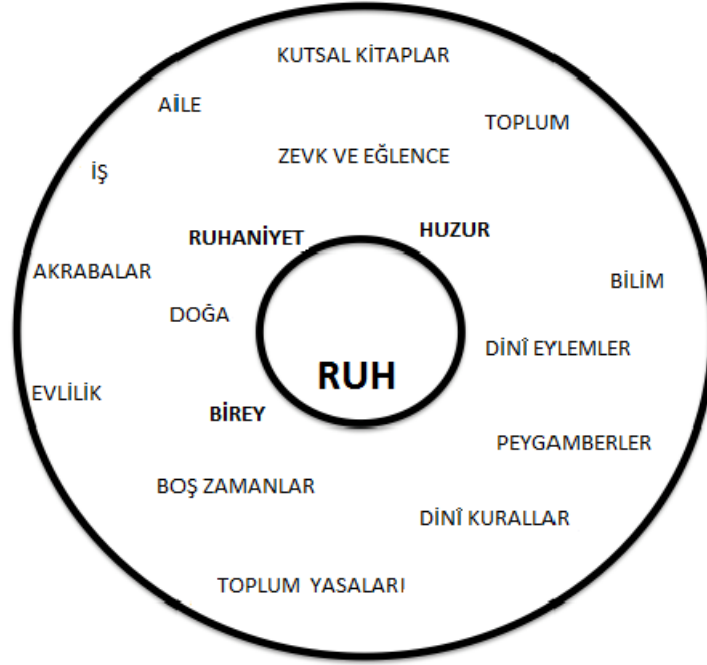
Şekil 2: Ruhânî bakış açısı: Ruhaniyet, bireysellik vb. merkezde, fakat kutsal kitaplar ve dinî kurallar şeklin alt kenarındadır. İş, aile, ilim vb. gibi "normal" hayata ilişkin konular daha az önemi olan konular olarak görülürler. Çünkü önemli şeyler gerçekte ruhsal yani fiziksel olmayan seviyede yaşanılır.

Ruhaniyete değer veren akımlar, insan odaklı düşüncenin arkasındaki materyalist temelleri paylaşmamalarına rağmen sıkı dogmatik öğretiden kaçınan ve bireyselliği öne çıkaran akımlar olarak, insan odaklı bakış açısı ile iyi geçinirler. Batı ülkelerindeki sıradan dindar Relativizm, mutlu olma arzusu ve huzura kavuşmayı değişik şekillerde mümkün kılar. Yeter ki hümanizmin temel kuralına göre gerçeğin asıl belirleyicisinin insan olduğu sorgulanmasın.