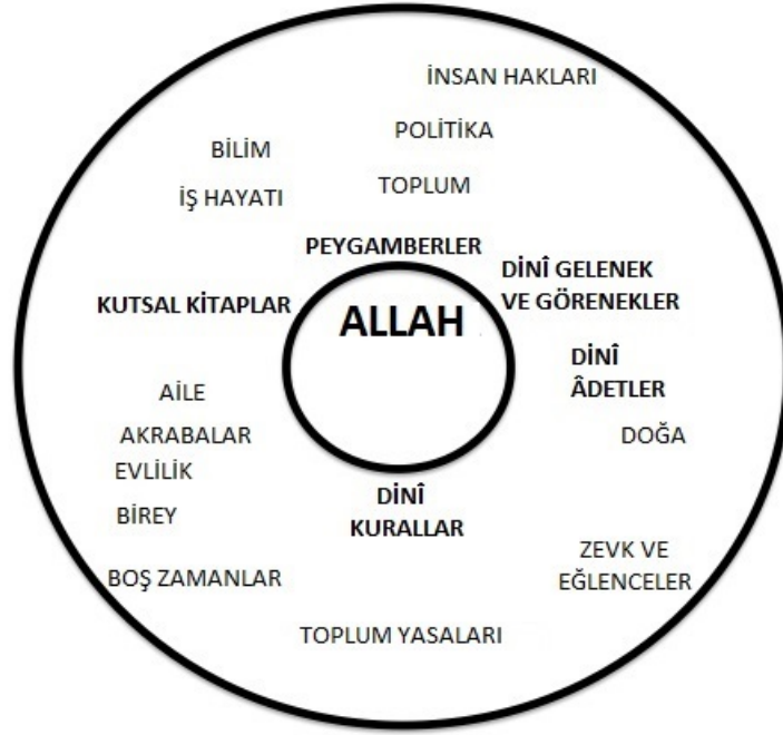
Şekil 3: Tanrı odaklı bakış açısı: Merkezde Allah olduğunda, Kutsal Kitaplar, peygamberler, Allah'ın bildirisinden kaynaklanan kurallar ve yaşantı şekilleri merkeze yakındırlar. Bu sistemde insan kendi haklarını belirlemez, bunun yerine kişi hakları ve toplumsal yaşam Allah'ın bildirisine göre belirlenir. Allah'ın bildirisine göre yorumlanan gerçekleri sorgulayan konular merkezden uzaktırlar.

İnsan ve Ruh odaklı bakış açıları tarafından bakıldığında, tanrı odaklı bakış açısı dogmatik ve bireyi boyun eğdiren şekilde görünür. Tanrı odaklı düşüncüyü temsil edenler, Allah'ın bildirisinin kendileri için, demokratik şekilde anlaşmaya varılarak belirlenmiş toplumsal kuralları aşar konumda olmasından dolayı, kişisel hakları ve seçim yapma özgürlüğünü ön plana çıkaran toplumsal düzene karşı ve hatta bir tehdit olarak görülebilirler. Hayatın ölümden sonra da devam etmesi ve insanın bir gün Allah'a hesap vermesine dair düşünce, asıl olan her şeyin doğum ve ölüm arasında gerçekleştiği varsayımının aşılandığı insan odaklı düşüncüyü bozar.